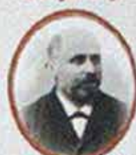
D. Sarcas de Istiz.