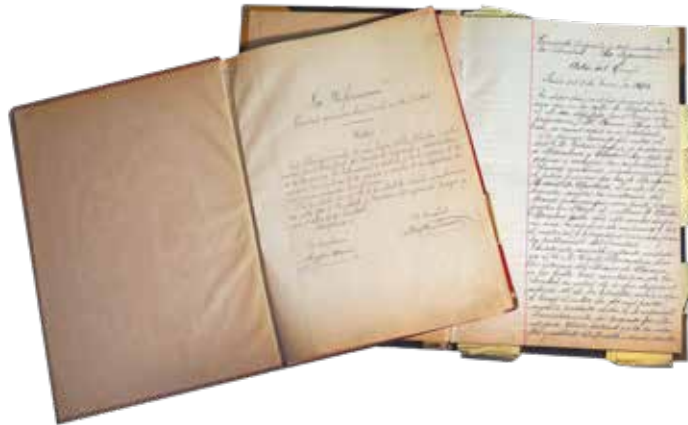
07_01_1903 LA PRIMERA ACTA DEL CONSEJO

Miramos al futuro con el foco puesto en seguir siendo una empresa sostenible e independiente que siga contribuyendo, con su actividad, al progreso y al bienestar de todos los navarros