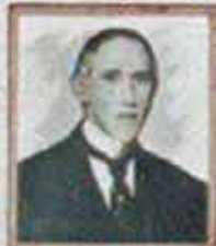
D. Miguel de Uganda.